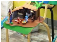
Atelier 1 : L'Epiphanie : l'arrivée des rois mages en histoire et coloriage

Les enfants de PS,MS,GS et CP répartis en 4 groupes ont pu participer à différents ateliers :