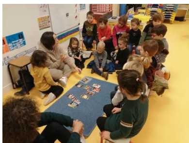
Atelier 3 : la joie : un sentiment observé sur des images et matérialisé par un smiley