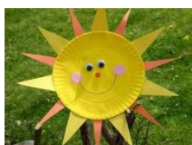
Atelier 4 : offrir de la joie : fabrication d'un soleil à offrir