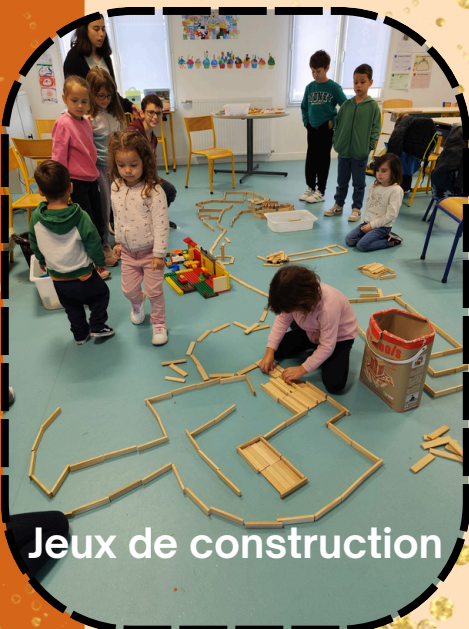
Jeux de construction