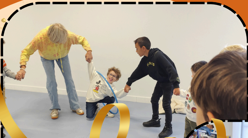
Jeux de langage