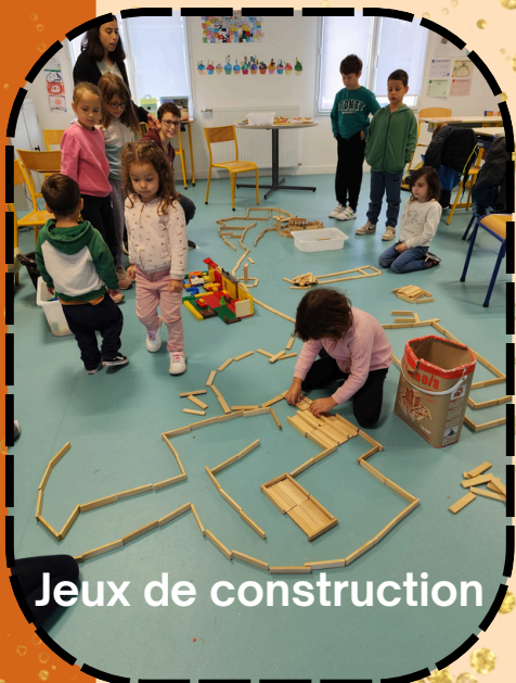
Jeux de construction